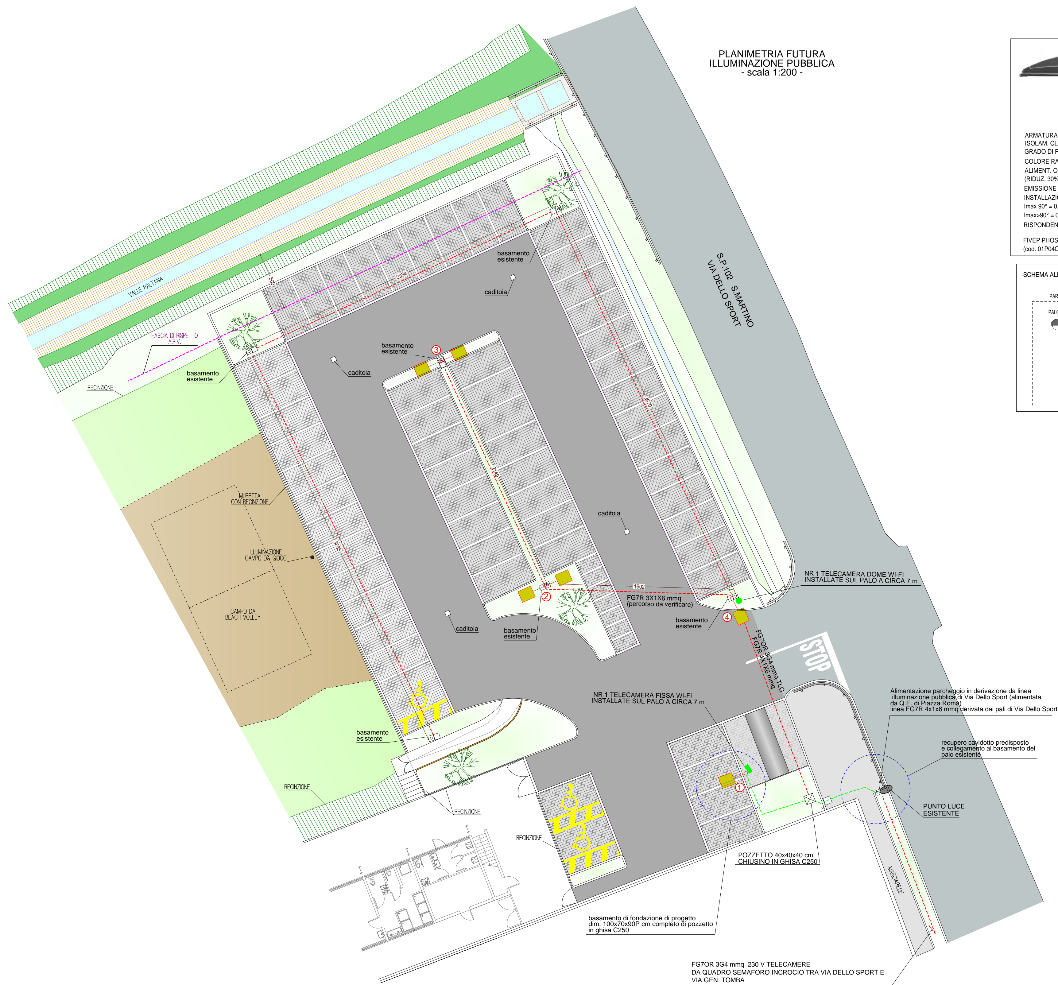
PLANIMETRIA FUTURA ILLUMINAZIONE PUBBLICA - scala 1:200 -